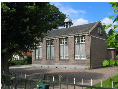
christelijke basisschool 'Het Mosterdzaadje' in de buurtschap Gortel

Gortel bestaat uit ca. 25 boerderijtjes, boshuizen en een schooltje. Het plaatsje telt ca. 70 inwoners.